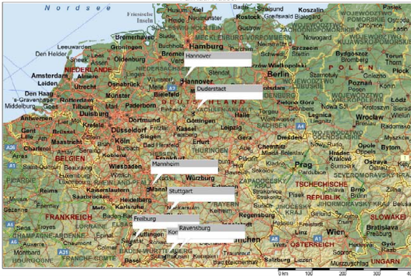
Folie Nr. 10